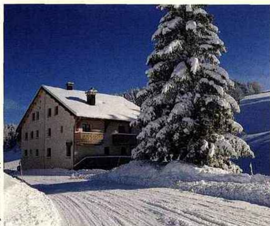
logis-hôtel les trappeurs