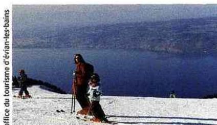
office du tourisme d'évian-les-bains

S ki et bien-être forment un duo gagnant depuis quelques années. Ce sont évidemment les stations thermales qui tirent leur épingle du jeu, et la charmante ville d'Evian-les-Bains, posée sur la rive sud du lac Léman, face à la Suisse, à de sérieux atouts à faire valoir. D'abord, son emplacement exceptionnel en bordure du paisible lac, mais aussi sa proximité avec la petite station de Haute-Savoie de Thollon-les-Mémises, à quinze minutes seulement, et