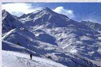
office du tourisme d'orelle

Imaginez les Trois-Vallées en version low cost. C'est ce qu'offre Orelle, un village de charme qui regroupe trois hameaux reliés au plus grand domaine skiable du monde (600 km de pistes). Bien entendu, on pourra s'offrir un bain de foule à Val-Thorens et aux Ménuires, mais on sera sans doute bien plus séduit par le charme de cette station avec ses authentiques maisons de pierre aux toits de lauze, ou la possibilité d'aller à skis découvrir