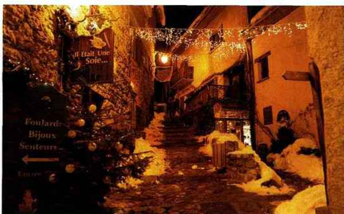
office du tourisme du massif de l'oisans