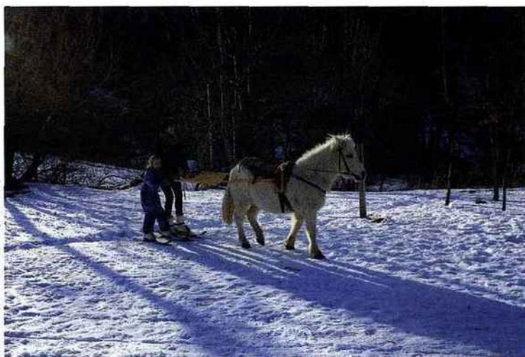
office du tourisme d'auvergne-sancy