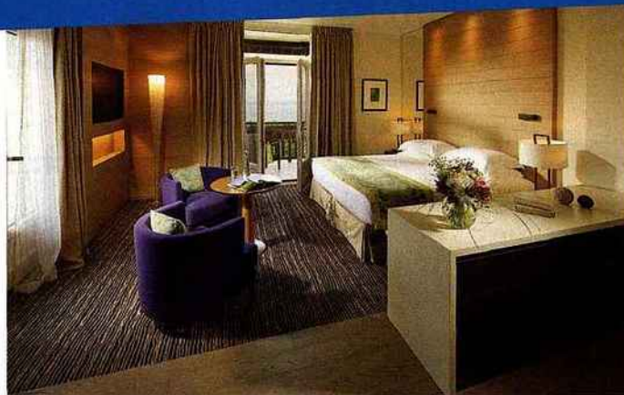
ph.hahn / evian resort